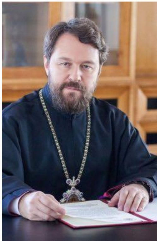
Митрополит Волоколамский Иларион